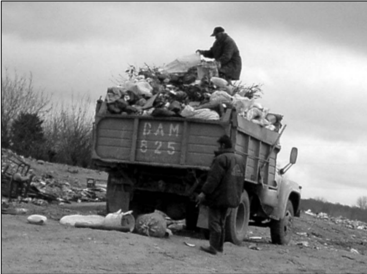
ქუთაისის ნაგავსაყრელს გარემოზე ზემოქმედების ნებართვა დღემდე არ გააჩნია