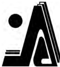
საქართველოს სტრატეგიული კვლევებისა და განვითარების ცენტრი