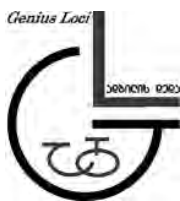
ადიგლის დედა, სათემო ფონდი